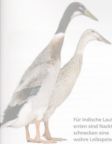
Für Indische Laufenten sind Nacktschnecken eine wahre Leibspeise

oder her, kurz und bündig mit dem Spaten halbiert habe, wobei ich mir allerdings gelegentlich schon wie ein mittelalterlicher Scharfrichter vorgekommen bin. Den Rest haben die Amseln erledigt. Obwohl ich kürzlich gelesen habe, dass man Schneckenleichen tief eingraben soll, da sie sonst ihre kannibalischen Artgenossen anlocken.